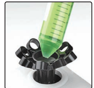
Unique Multi-Head allows for standard vortexing Plus holds up to 8 microtubes