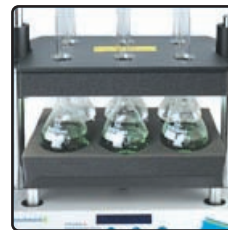
6 X 50, 100 or 250ml Volumetric Flasks