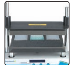
3 x microplates/96 Well Tube Racks