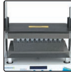
50 X 1.5/2.0ml

매우 다양한 종류의 용기, rack, 기타 응용 기구 (수평 또는 수직)에 바로 적용가능. 펄싱 프로그램 기능은 시간 간격을 두고 특정 시간에만 작동 하면서 교반 동작의 강도 높일수 있다. 버튼만 누르면 최고 100시간까지 작업자 감독 없이 동작.