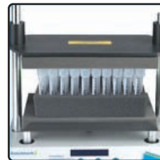
50 X 5.7 or 10ml