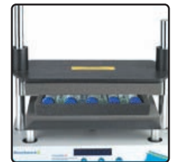
9 X 50ml Horizontal QuEChERS Method